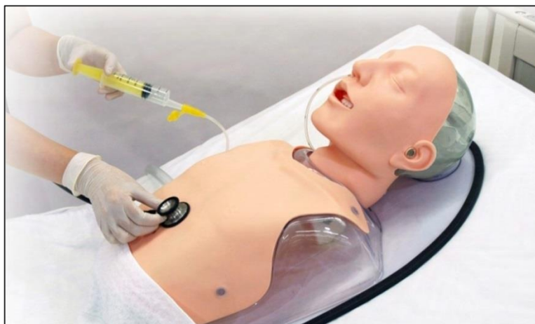
از قرارگیری سوند در معده اطمینان حاصل کنید.