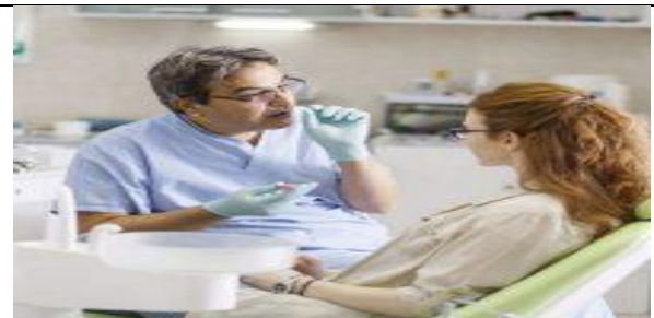
مددجو را در پوزیشن نشسته یا یک پهلو قرار دهید.