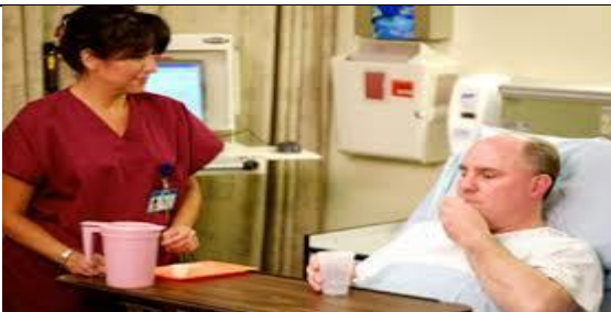
دارو را همراه با یک لیوان آب به مددجو بدهید و تا زمان بلع کامل دارو کنار مددجو بمانید.