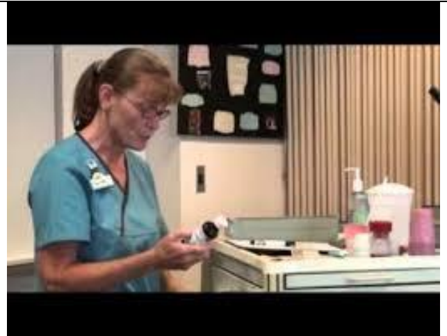
مشخصات، نام و تاریخ داروی مورد نظر را چک کنید.