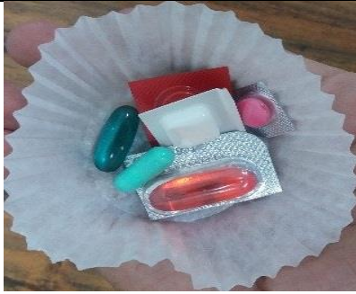
نمونه کاپ دارویی که برای دادن قرص و کپسول به مددجواستفاده میشود.