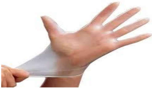
دستکش تمیز بپوشید.