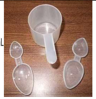
نمونه هایی از کاپ دارویی که برای دادن شربت ها استفاده میشود.