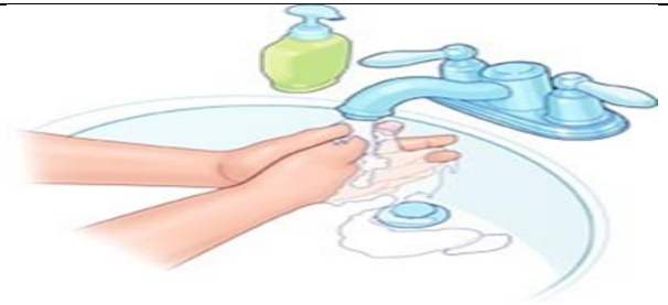
دست ها را بشوید