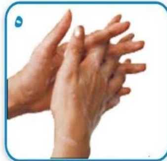
۵ مالیدن کف دستها با انگشتهای درهم