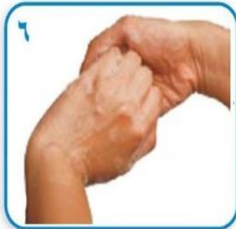
۶ پشت انگشت ها را داخل کف دستها ببرید تا در هم قفل شوند