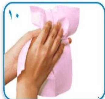
۱۰ با یک دستمال حوله ای بطور کامل خشک کنید