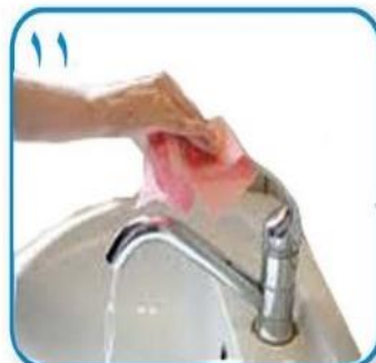
۱۱ از همان دستمال برای بستن شیر آب استفاده کنید