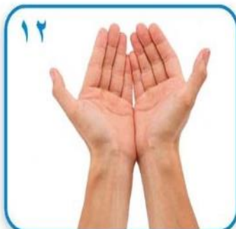
۱۲ اکنون دستهای شما کاملا تمیز و مطمئن هستند