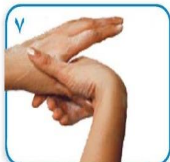
۷ مالش گردشی شست یک دست در داخل کف دست دیگر و بالعکس