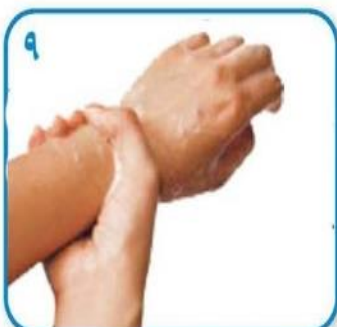
۹ مچ دستها را کاملا آبکشی نمایید