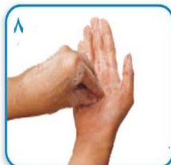
۸ مالش های مدور و رفت و برگشتی با انگشتان بسته یک دست روی کف دست دیگر و بالعکس