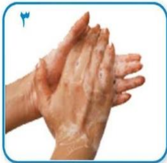
۳ کف دست ها را به هم بمالید