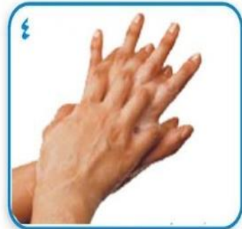
۴ کف دست راست بر پشت دست چپ با انگشتهای درهم و بالعکس