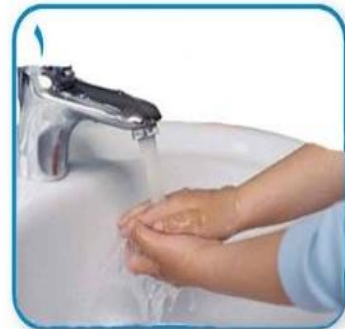
۱ دستها را با آب خیس کنید