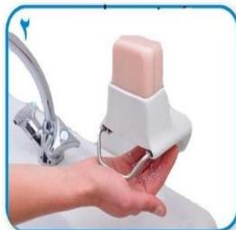
۲ صابون کافی برای پوشاندن سطح دستها بردارید