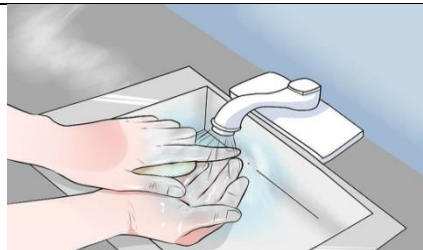
دستها را مجدداً بشویید و دستکش جدید بپوشید.