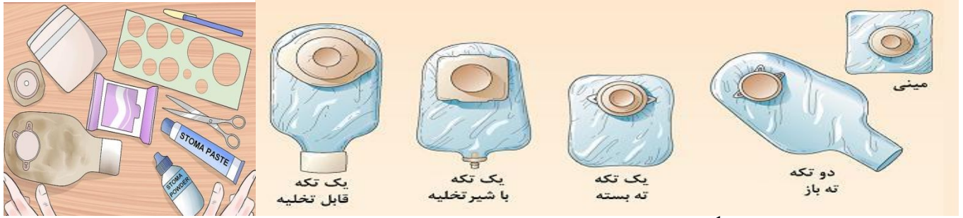
نمونه هایی از انواع مختلف بگ کلتومی

وسایل را آماده کنید: کیسه متناسب با اندازه استوما، نرمال سالین، دستکش تمیز، چند عدد گاز، کیسه زباله