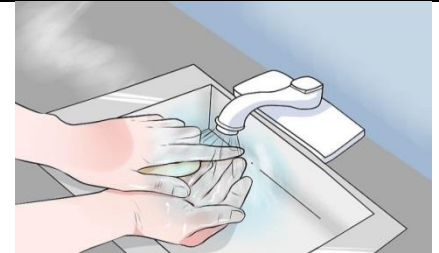
دستها را بشویید.