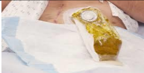
مایع دفع شده در کیسه را اندازه گیری نمایید.