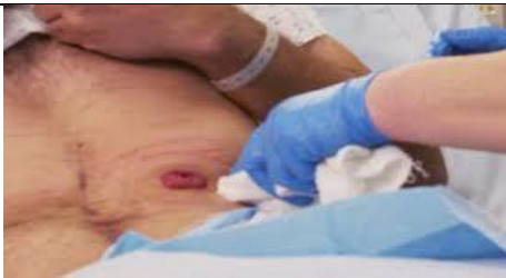
پوست اطراف استوما را توسط گاز به صورت کامل خشک کنید.