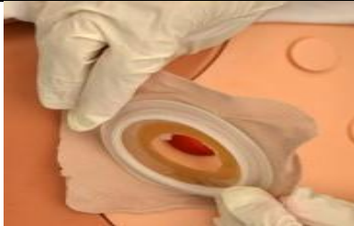
کیسه پر را از محل استوما جدا کنید.