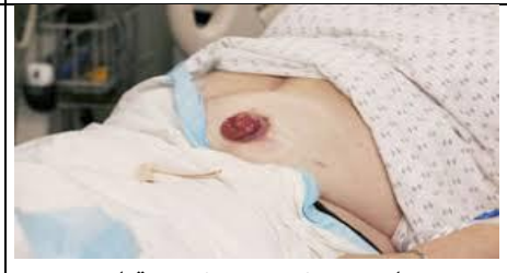
مددجو را در پوزیشن نیمه نشسته قرار دهید و پوشش های روی ناحیه زخم را بردارید.