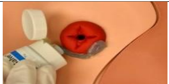
یک لایه از پماد ضد سوختگی را روی پوست اطراف استوما بیافزایید.