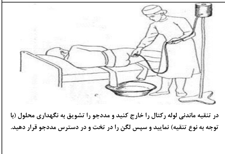
در تنقیه ماندنی لوله رکتال را خارج کنید و مددجو را تشویق به نگهداری محلول (با توجه به نوع تنقیه) نمایید و سپس لگن را در تخت و در دسترس مددجو قرار دهید.