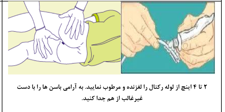
۲ تا ۴ اینچ از لوله رکتال را لغزنده و مرطوب نمایید. به آرامی باسن ها را با دست غیر غالب از هم جدا کنید.