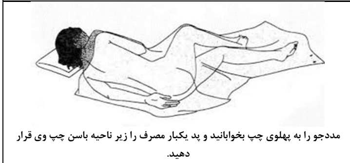
مددجو را به پهلوئی چپ بخوابانید و پد یکبار مصرف را زیر ناحیه باسن چپ وی قرار دهید.