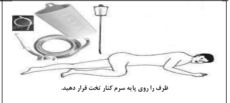
ظرف را روی پایه سرم کنار تخت قرار دهید.