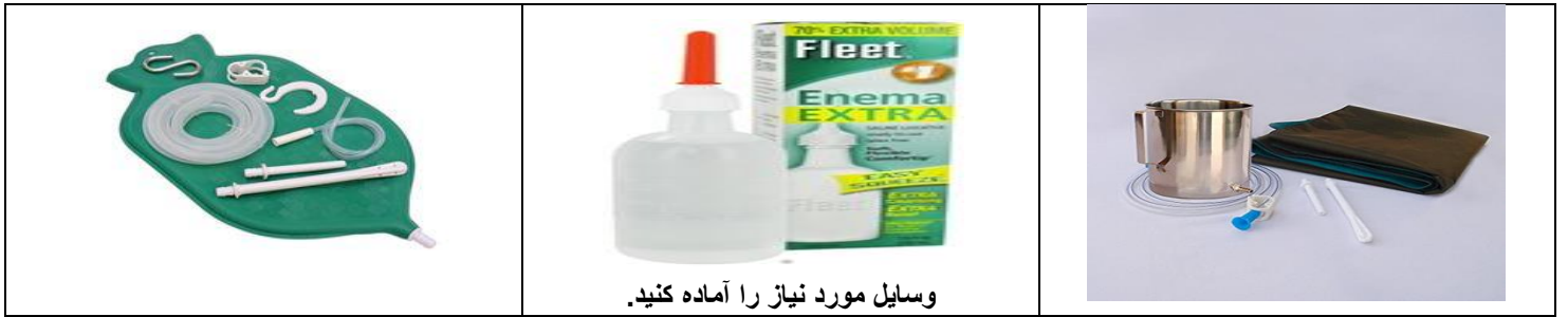
وسایل مورد نیاز را آماده کنید.