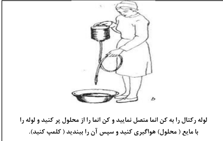
لوله رکتال را به کن انما متصل نمایید و کن انما را از محلول پر کنید و لوله را با مایع (محلول) هواگیری کنید و سپس آن را ببندید (کلمپ کنید).