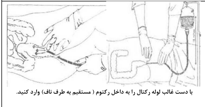
با دست غالب لوله رکتال را به داخل رکتوم (مستقیم به طرف ناف) وارد کنید.